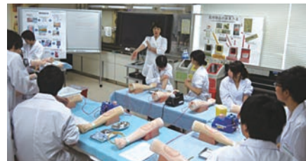
医学部医学科2年生:生理学実習 心臓病診察シミュレーター“イチロー”、呼吸音聴診シミュレーター“ラング”、採血静脈シミュレーター“シンジョー”