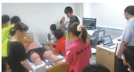
医学科3年生:薬理学実習 救急ケアシミュレーター“ECS”