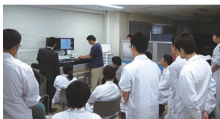
保健学科放射線技術科学専攻2年生:基礎医学実習 血管インターベンショントレーナーMentice VIST